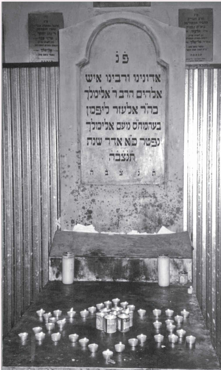
מצבתו של ר' אלימלך מליז'נסק