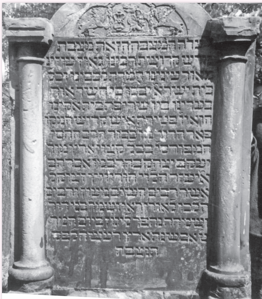
"החווה מלובלין" - ר' יעקב יצחק הורוביץ נולד בשנת תק"ה (1745) ונפטר בשנת תקע"ה (1815)