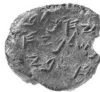
יהוכל בן שלמיהו בן שבי