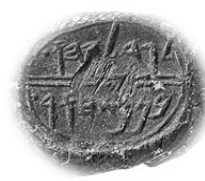
גדליהו בן פשחור

המטבעות המוקדמים יותר שנמצאו בארץ ישראל הן מתקופה הפרסית, מהמאה הרביעית 3 , ונמצאו באיזור דרום הר חברון. המשותף למטבעות היא הכתובת 'יהד' 4 המוטבעת עליהם, וקשורה ככל הנראה לשמה של הפחוה בימי פרס, מה שהקנה למטבעות את הכינוי 'מטבעות יהד'. על מטבעות אלו נמצאו הטבעות שונות: עוף דורס, ליליות, פני אדם, ועל כולם: כמין אל יושב על מרכבה ובידו בז.