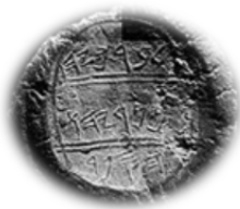
ברוך בן נריה