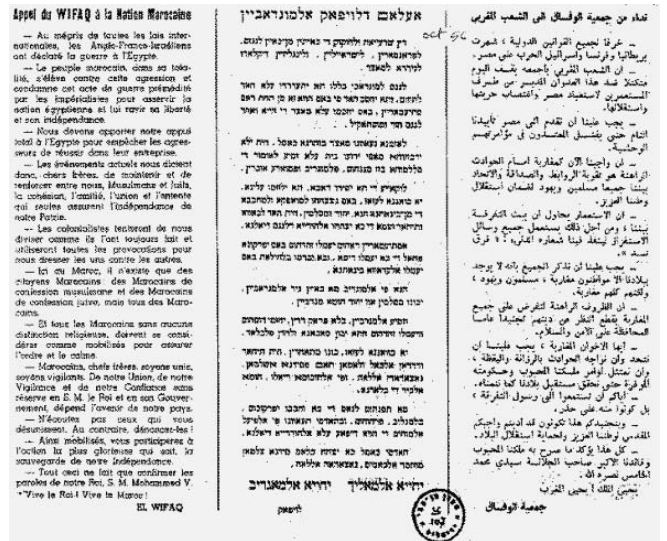
כרוז של ארגון אל-וויפאק

אשר לבעיית היציאה לעבר אופקים חדשים של גורמים יהודיים אחדים שלא הצליחו להתאים את עצמם לקצב הכללי החדש של המדינה, הבענו יותר מפעם אחת את דעתנו על זה. אולם, אין אנו יכולים לעמוד בפיתוי להביא את דברי עלאל אלפאסי עת היה שר ולעומתם את דבריו כשעבר לאופוזיציה. אז יתברר מה ההבדל בין מפלגה קואליציונית ובין מפלגת אופוזיציה. היהודים אינם נושא למיקוח פוליטי שמנצלות