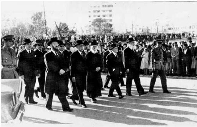
ראשי הקהילה בתהלוכה אחרי מות המלך מוחמד החמישי בפברואר 1961

המרקונים, החיים בעוני כמו המוסלמים המרוקנים. יש להסביר להם שהם מנוצלים וכי האינטרסים שלהם ושל המוסלמים זהים. 76