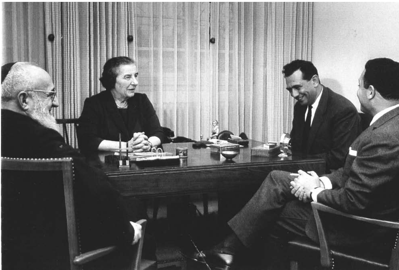
ביקור נשיא הקהילה דוד עמר אצל גולדה מאיר עם נציג המוסד בנימין רותם

קהילת קזבלנקה, שרב העיר וראשי הקהילה לא השתתפו בקבלות הפנים כיוון שלא הוזמנו אליהן. 60 נראה שהשלטונות היו מפוכחים דיים כדי שלא להביך את ההנהגה היהודית עם הזמנה מסוג זה. עם זאת, איחוד העבודה המרוקני קיים כנס מוסלמי-יהודי ב-10 בינואר במחאה על פעולות המשטרה. 61 ההתנכלויות לא אירעו בימי ממשלת השמאל שהואשמה בניהול מדיניות פאן-ערבית, אלא בימי שלטון מוחמד החמישי ובנו, שהסתייגו מאישיות נאצר וחששו מחתרנותו. סדרת האירועים שהחלו בהתפרצות האנטי-יהודית בוועידת קזבלנקה ואחר כך אסון טביעת ספינת העולים "אגוז" ב-10 בינואר 1961, ההתקפות בעיתונות הבין-לאומית על השלטונות המרוקניים ועל המעצרים, הניעו את ראשי הקהילה לבקש פגישה עם המלך. הם התכוונו לנקוט פעולה שתמנע התפרצות אלימה של ציבור מוסלמי בתגובה על הפצת כרוז ישראלי שהאשים את מרוקו באחריות לטביעת ספינת העולים. בעקבות סדרת מעצרים שביצעה משטרת מרוקו בקרב מתנדבי "המסגרת", הרשת המחתרנית שפעלה משנת 1955 סיימה סופית את תפקידה באוגוסט 1961.