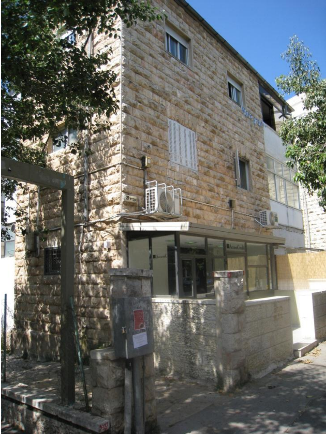
הבית ברחוב קרן-קיימת מספר 21