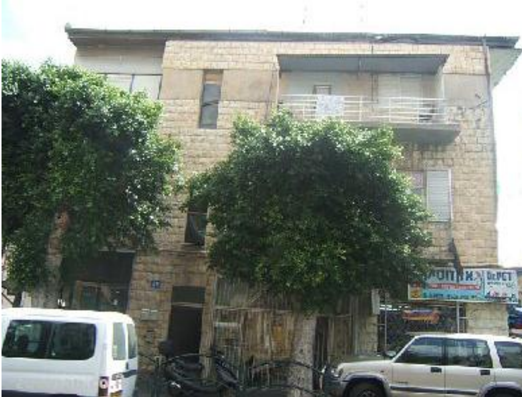
הבית ברחוב הרצל מספר 83, הדר הכרמל, חיפה