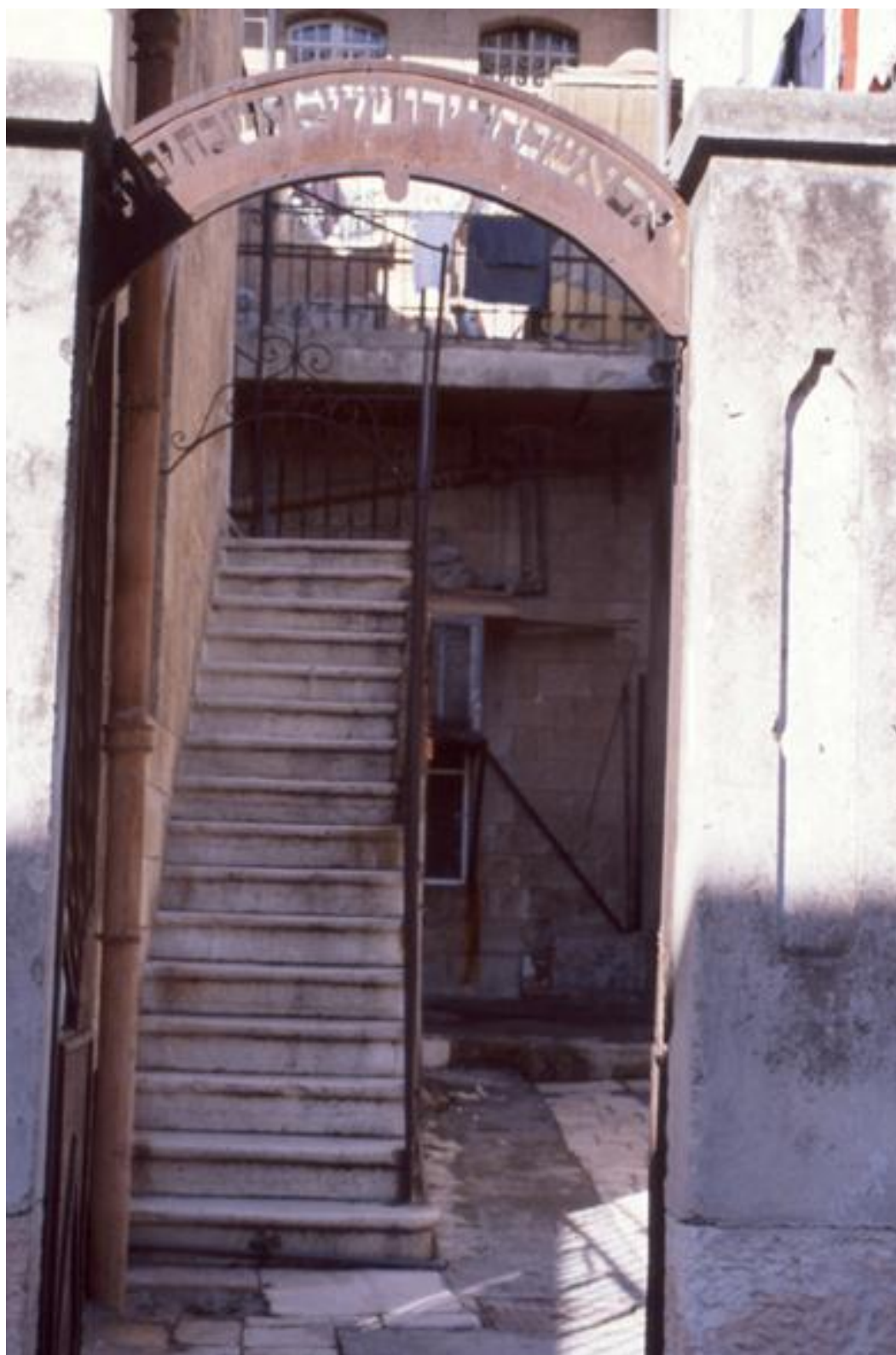
המדרגות שהובילו לקומה השנייה