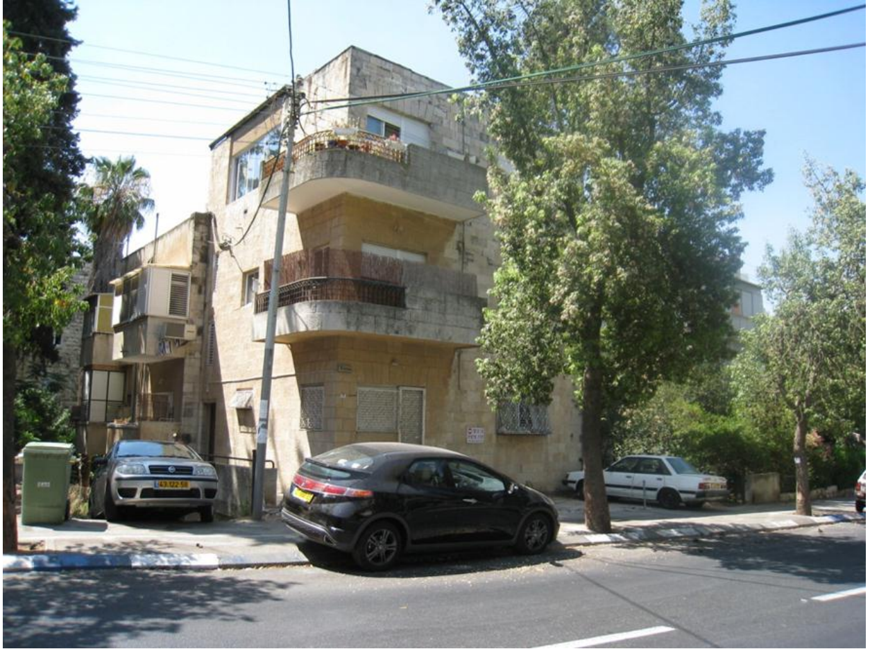
הבית ברחוב מטודלה מספר 16