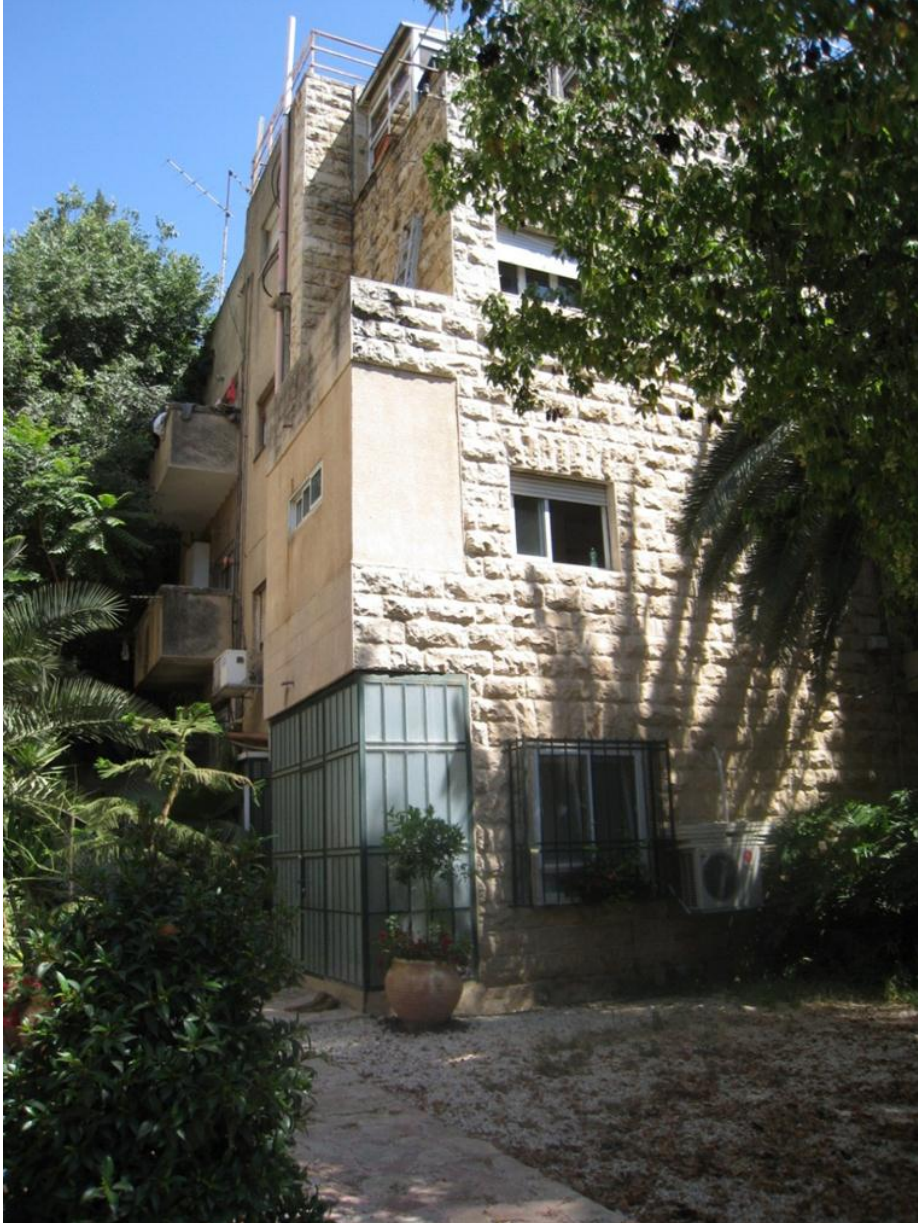
הבית ברחוב מטודלה מספר 9

בקרית שמואל בנו הסב ובנו הצעיר מרדכי שני בתים נוספים: האחד ברחוב מטודלה מספר 9, בו התגורר הסב צבי משה עם אשתו השנייה פייגע; והשני ברחוב מטודלה מספר 16, בו התגורר מרדכי עם אשתו פרומה ושלושת ילדיהם (בלהה, בועז ויעל).