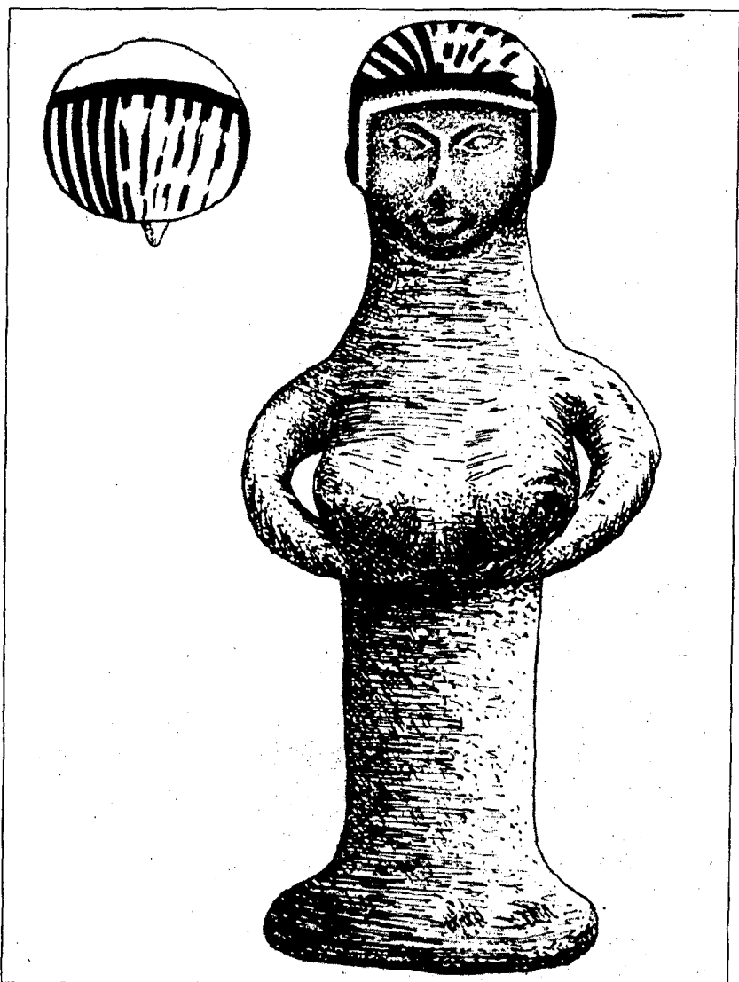
איור 4: צלמית "עשתורת" מן הקבר שליד קבר רחל

ותסרוקתה עוצבו בעזרת מכחול בצביעה בכחול כהה. 2 טאב תארך את הצלמית למאה השביעית לפני הספירה (Tubb, 1980, 13-14) וקשר את הופעתה לרפורמות הדתיות של