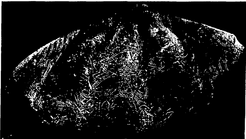
איור 2: צדף טרידקנה סקומוזה מעוטר מן הקבר שליד קבר רחל