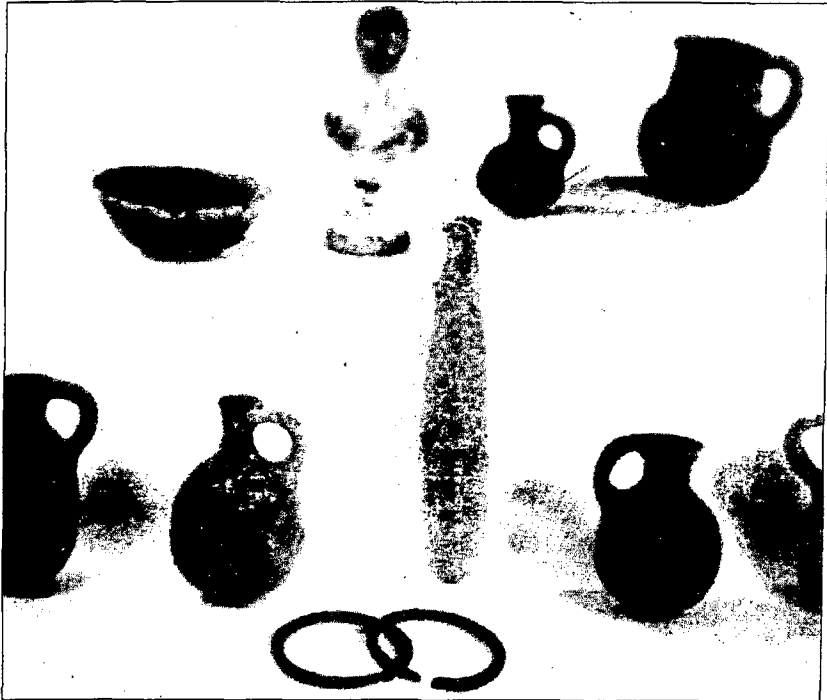
איור 1: מכלול הממצאים מן הקבר שליד קבר רחל