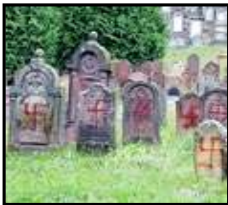
צלבי קרס על מצבות בבית הקברות בפריז