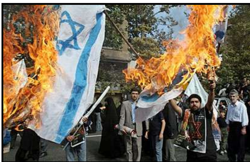
מפגינים באיראן נגד ישראל