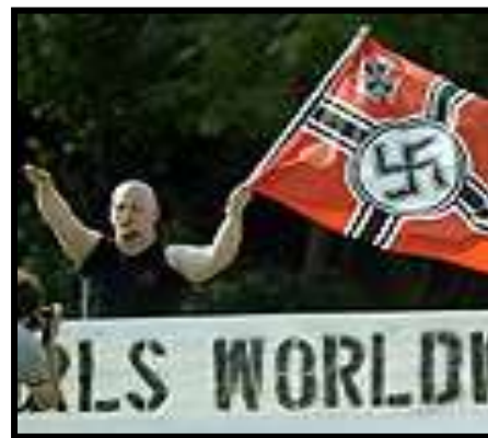
כינוס ניאו-נאצים בארה"ב