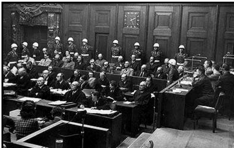
משפטי נירנברג. תמונה מ- 10.12.1945