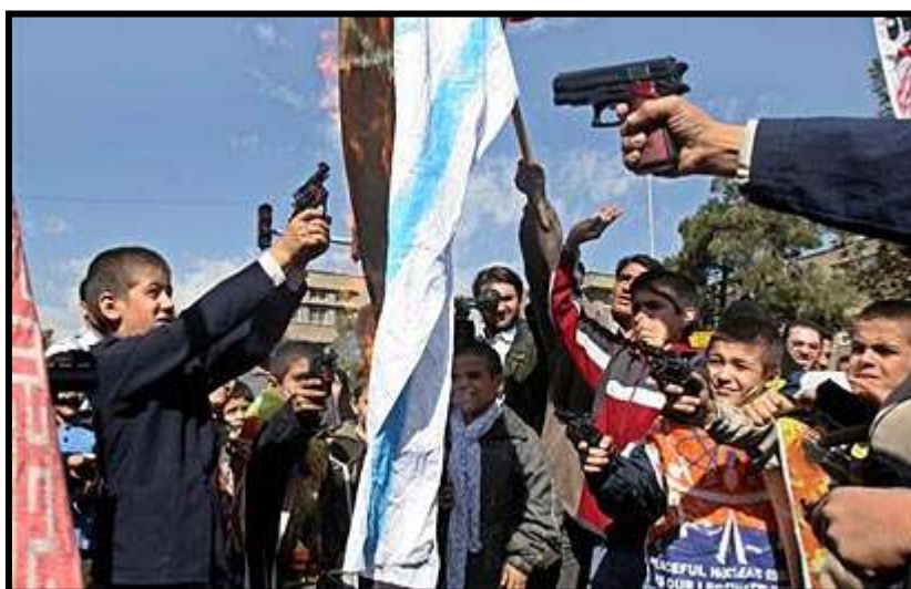
תהלוכת "יום ירושלים" באיראן