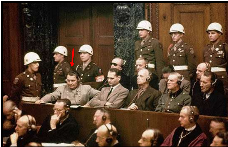
נאשמי המשפט שימו לב לשיבתו היהירה והמזלזלת של גרינג

השיחות בין גילברט לגרינג חשפו את המשנה הסדורה של המנהיג הנאצי אודות המלחמה שחוה ואת שהתרחש בעקבותיה. בין היתר טען שגרמניה חייבת להיות נאצית שכן ריבוי מפלגות רע לעם הגרמני. הוא טען שהעדיף שרוסיה תתקוף ראשונה ולא לתקוף אותה, קבע כי אסור היה להסכים עם חוזה ורסאי וכי הקמת הלופטוואפה וחיזוקו היה הכרח. בנקודה אחת ביקש לסנגר על עצמו וטען בתוקף כי מעולם לא נתן שום פקודות לביצוע "מעשי הזוועה הללו". 18