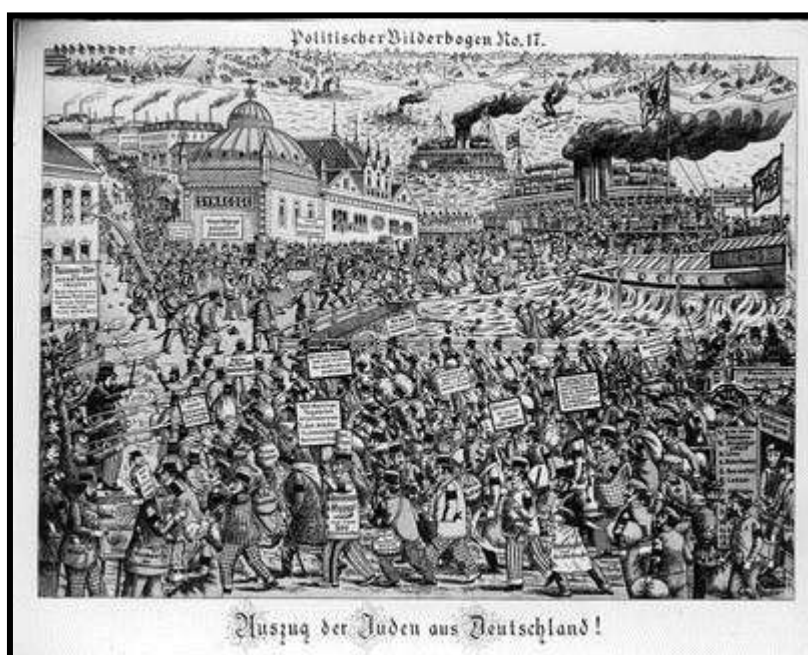
קריקטורה: 'יציאת היהודים מגרמניה'

נפסק גם הקשר בין גורמים חיצוניים לבין מתיחות אנטישמית. הורגלנו בשנים ובדורות הקודמים שתעמולת השטנה גדלה בתקופה של קושי כלכלי או מדיני, ואילו בתקופות רגילות היא יורדת בהרבה. לא כן היום. השעבוד המדיני פסק במידה רבה עם מיגור הפשיזם והנאציזם במלחמת העולם, ועם המאבק לשחרור המושבות (תהליך ה"דיקלונזציה") שהתחיל מיד לאחר כך; גם המצב הכלכלי בעולם נשתפר בהרבה אחרי המלחמה, והעוני ההמוני, בעיקר בארצות מזרח-אירופה ששימש קרקע פורייה לתעמולת שטנה בשנים הקודמות, כמעט ונעלם. האנטישמיות היום חודרת אפוא לחוגים רחבים של האוכלוסייה כאילו ללא סיבה של ממש. תוך כדי כך לא קל גם להסביר אופיה. החלוקה לסוגים שונים של אנטישמיות שעליה דובר לעיל, אין לה מקום בימינו. אין בודאי לדבר - פרט למקרים בודדים - על אנטישמיות דתית, כי כאמור הכנסיות הדתיות עצמן נתגייסו למלחמה בה; אין לדבר כמו כן על אנטישמיות כלכלית או לאומית במובנה הרגיל או הגזעי. משהו מכל הסוגים מבצבץ פה ושם, אולם לא הוא העיקר; התופעה במהותה היא מסוג אחר שטרם נודע בשנים הקודמות.