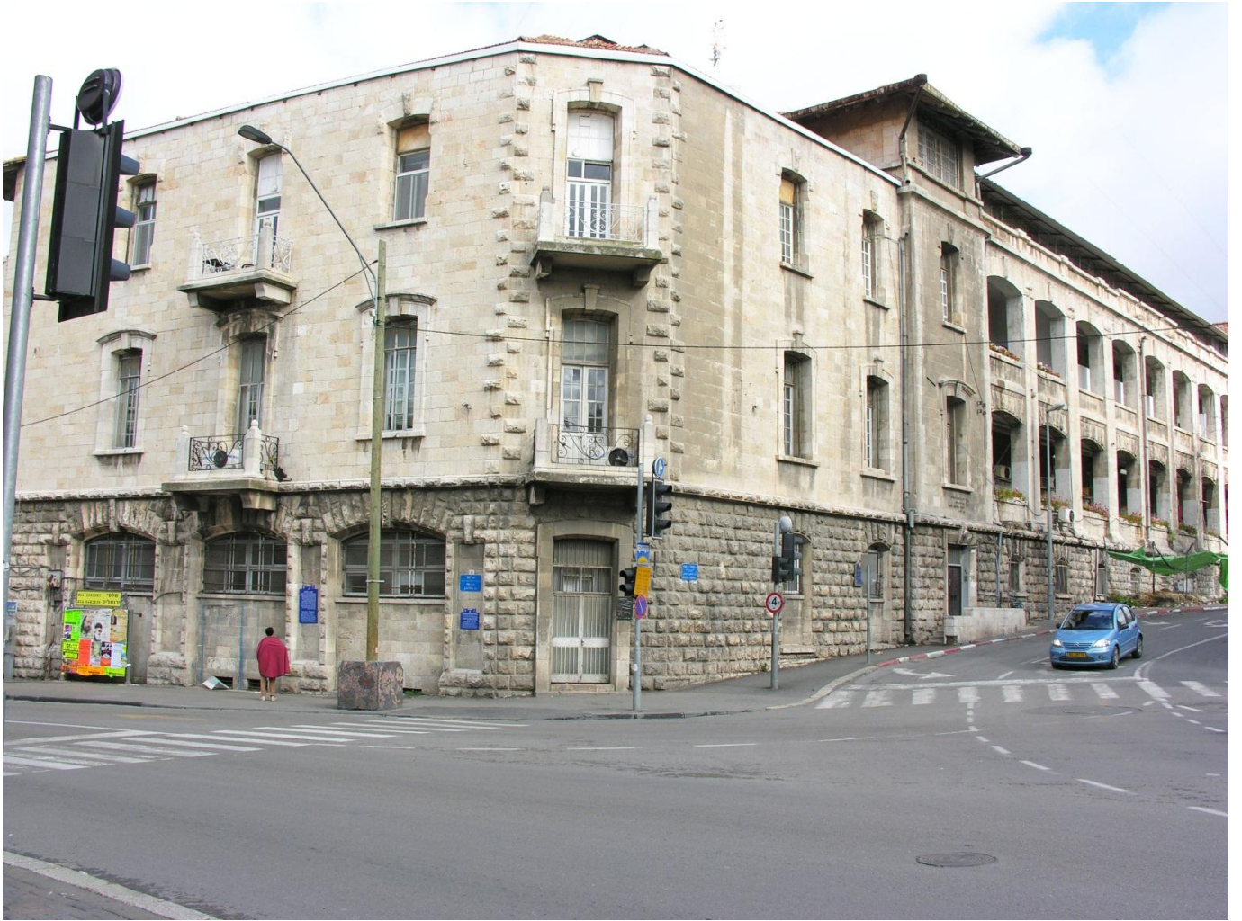
הכניסה למגרש הרוסים