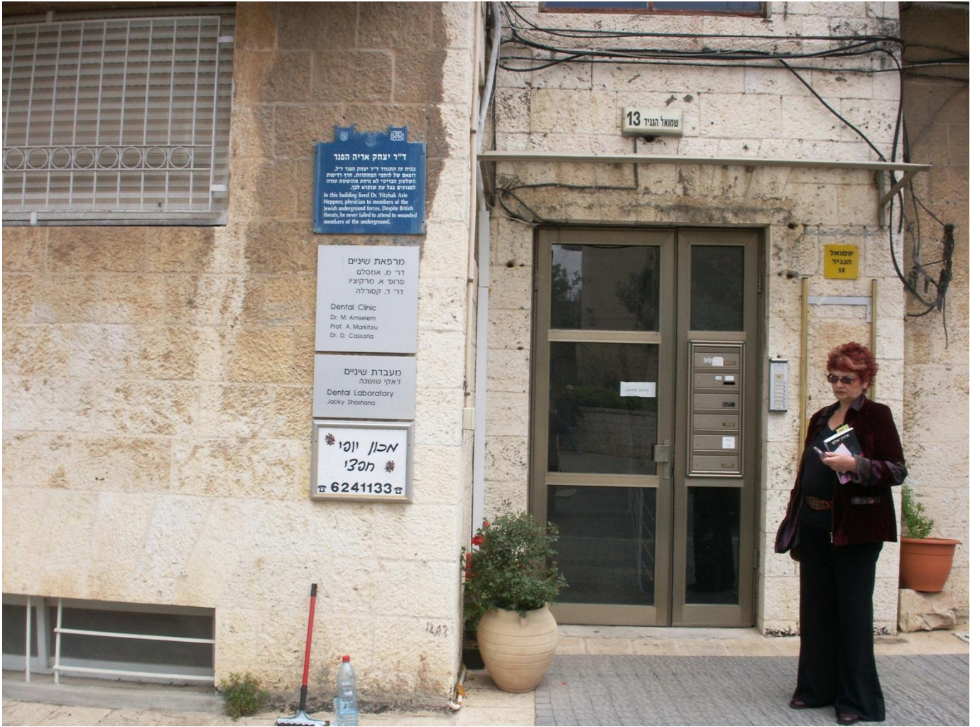
הבית ברחוב שמואל הנגיד 13