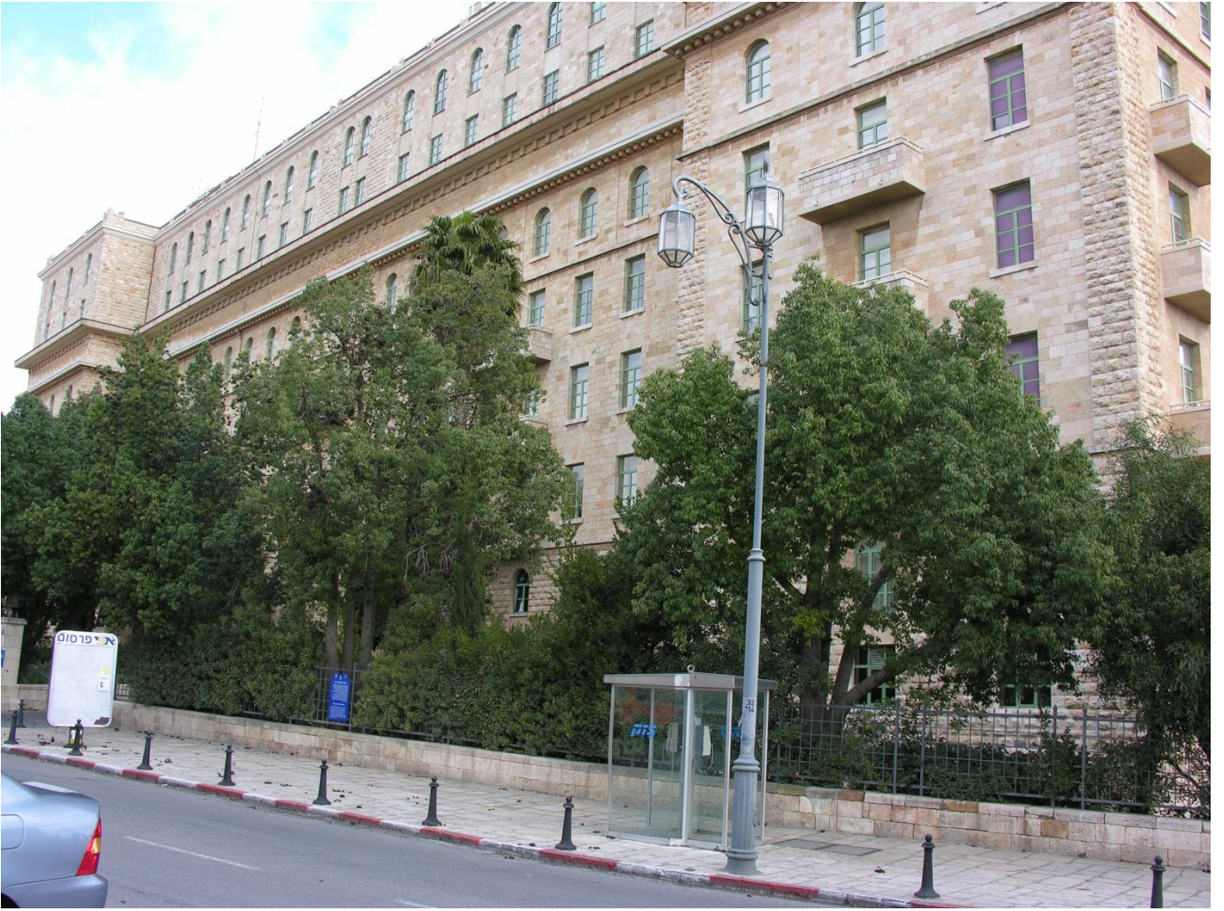
בניין מלון המלך-דוד