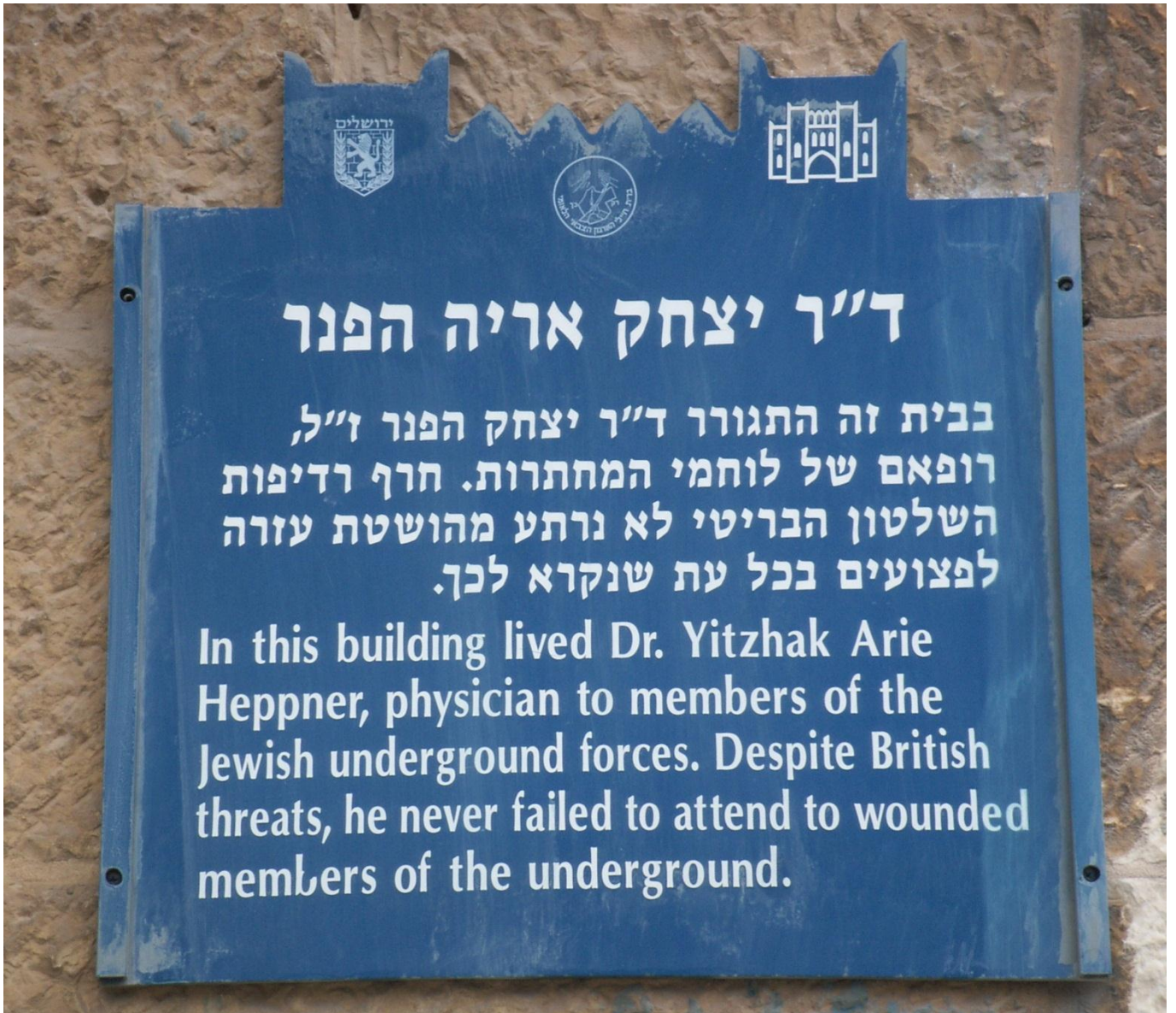
שלט על הבית ברחוב שמואל הנגיד 13