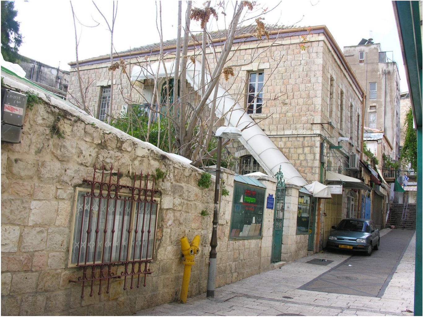
הבית ברחוב יעבץ 5