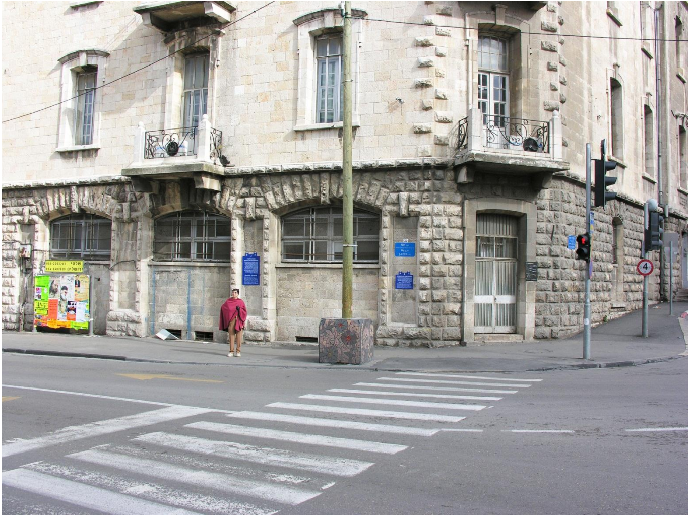
הבניין בו שכנה הבולשת המרכזית