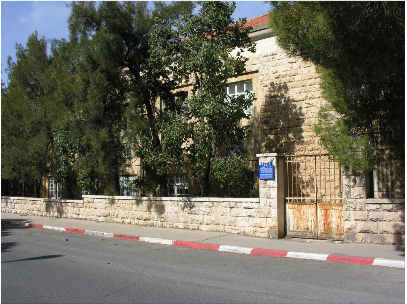
בית-הדין הצבאי ברחוב ז'בוטינסקי